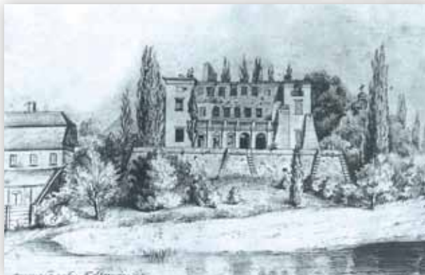
Zawieprzycze, pałac od strony rzeki Wieprz, stan z 1862 r.

W odrodzonej Polsce po roku 1918 utrzymała się gmina Spiczyn i stan ten przetrwał do czasów współczesnych.