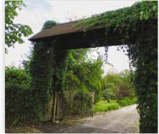
Brama wjazdowa na jedną z posesji (Z.J.)

Obecnie ta typowa wieś o charakterze rolniczym z wyjątkowo urodzajnymi ziemiami przekształca się powoli w jeden z największych polskich ośrodków produkujących wszelkie naturalne nawierzchnie sportowe i rekreacyjne. Produkowane są tutaj rolowane trawy na najbardziej wymagające boiska piłkarskie w kraju i za granicą.