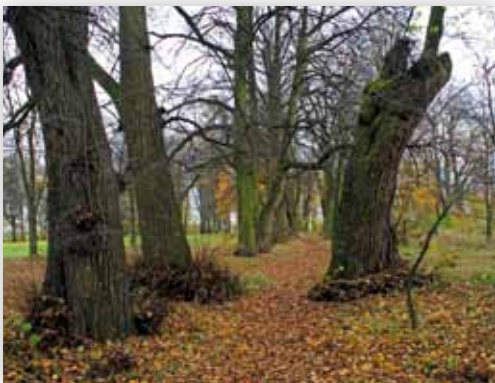
Aleja lipowa w zespole pałacowo-parkowym (A.K.)