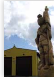
Rzeźba św. Floriana przy strażnicy w Januszówce (D.M.)

W początkach XIX w. dziedzicem dóbr kijańskich był książę Janusz Modest Sanguszko. Wtedy to oficjalnie założono nową wieś w ramach dóbr kijańskich i na jego cześć nazwano Januszówką. Wcześniej tę część wsi nazywano „Kijany Bliższe”. Pierwsza wzmianka o tej miejscowości pochodzi z wizytacji parafialnej w 1805 r. W aktach zapisano „Stoczek et Januszówka”. Kolejna wzmianka pochodzi z „Tabeli miast i wsi Królestwa Polskiego” z 1827 r., gdzie znajdujemy zapis, że mieszkało wtedy w Januszówce 186 osób i było 17 domów.