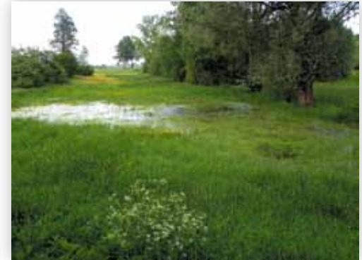
Wiosenne rozlewiska (Z.J.)