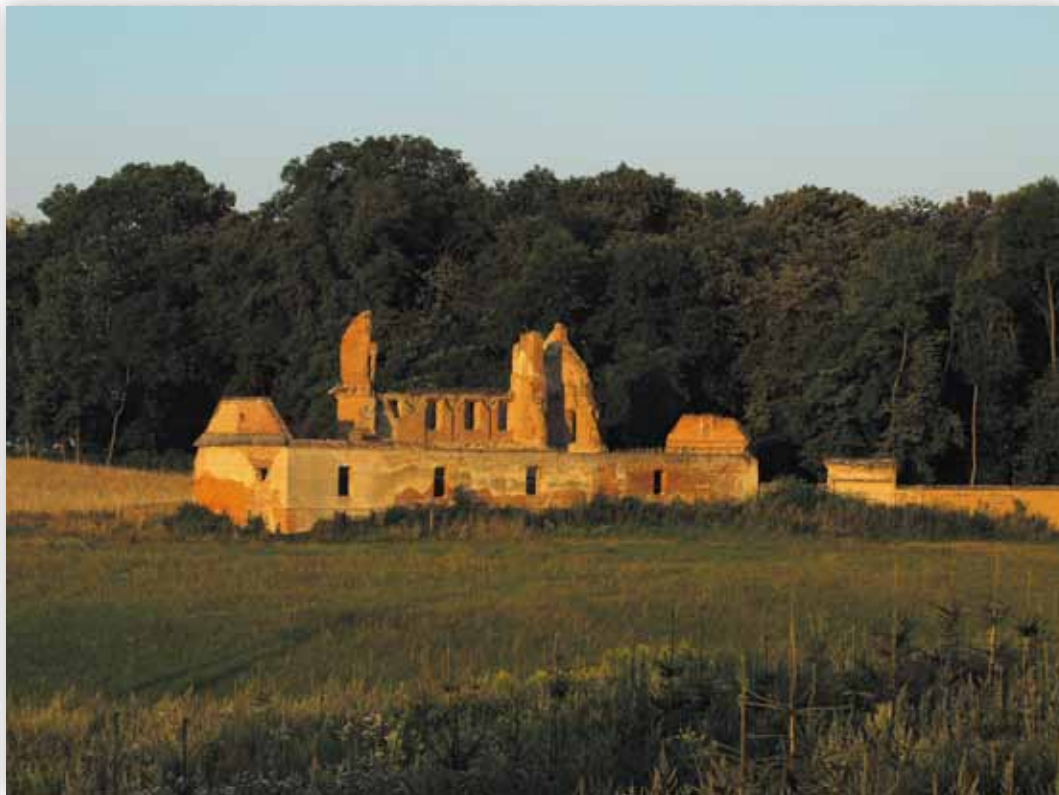
Ruiny oranżerii