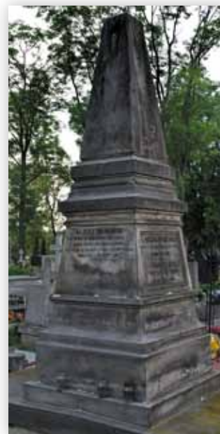
Grobowiec rodziny Skłodowskich na cmentarzu parafialnym