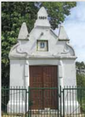
Kapliczka w centrum wsi (D.M.)