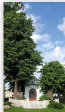
Kapliczka św. Jana Nepomucena na Mogiłkach (D.M.)