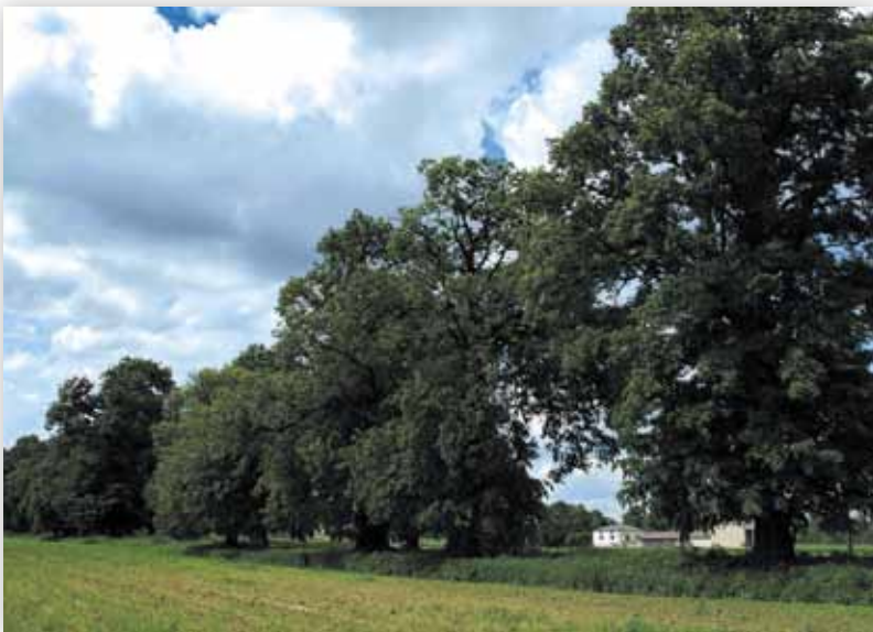
Aleja lipowa do dawnego folwarku w Charleżu (D.M.)