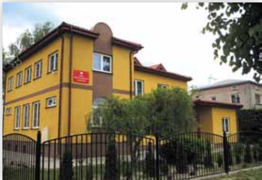
Budynek biblioteki i przedszkola (D.M.)

Etymologia ludowa wywodzi powstanie nazwy od zachowania staruszka, który chodził po wsi ze szpicą (zaostrzonym na końcu kijem) i pilnował w dzień i w nocy, aby w tej miejscowości panował spokój i porządek.