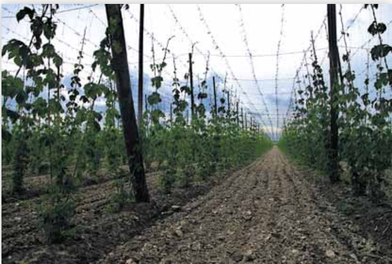
Uprawa chmielu (D.M.)