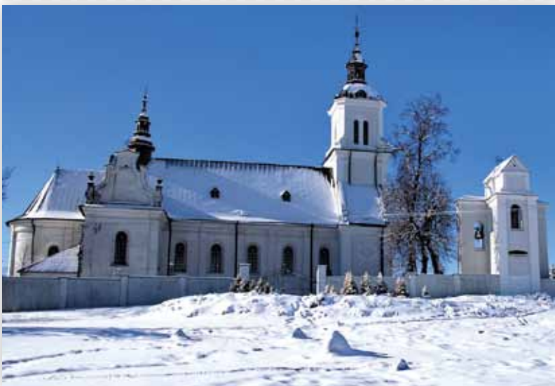
Kościół w Kijanach (D.M.)