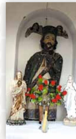
Drewniana rzeźba przedstawiająca św. Jana Nepomucena (D.M.)

rzeczy, pojмали także jeńców. Poproszono o pomoc księcia, który zadał najeźdźcom sromotną klęskę. Zginął przy tym ich król zwany Kumatą. Do dzisiaj niektórzy mówią, że odgłosy bitwy i jęki pokonanych czasem można usłyszeć z przepastnych bagien otaczających Jawidz.