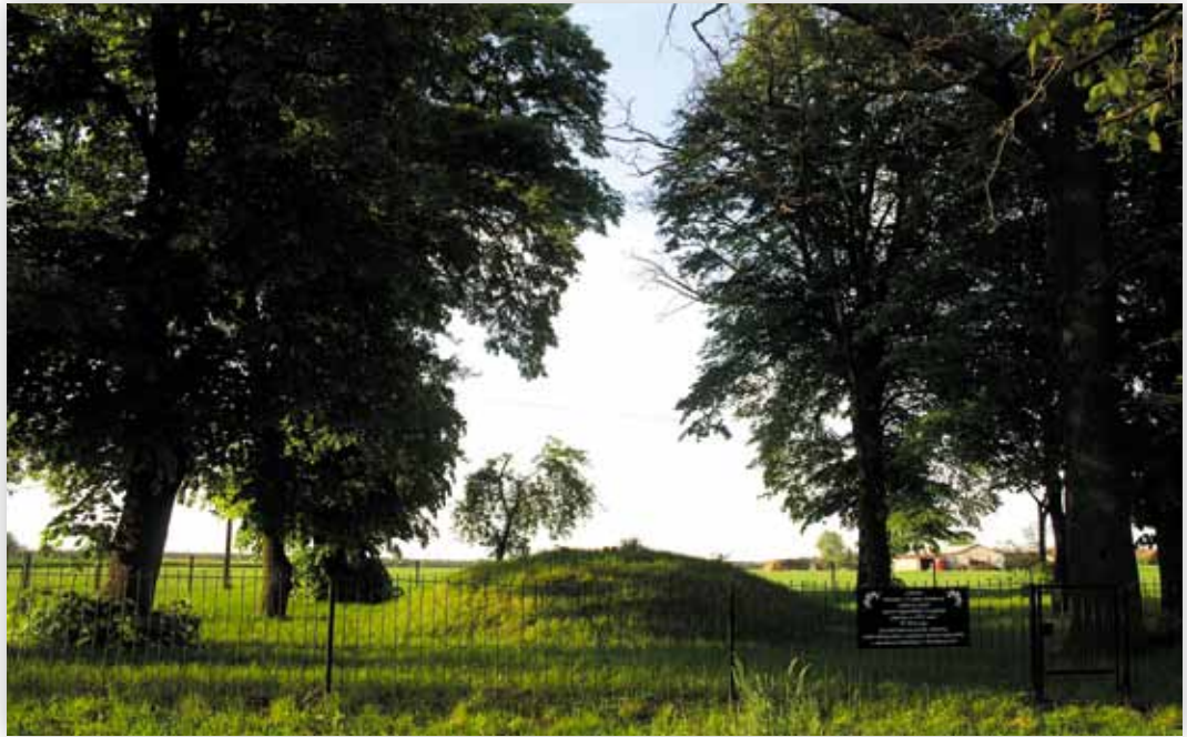
Cmentarz żołnierzy poległych w czasie I wojny światowej (D.M.)