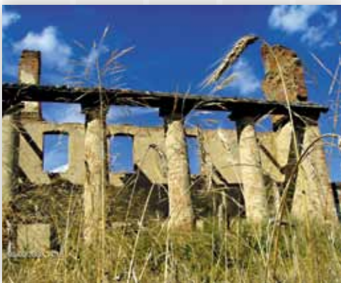
Fragment ruin oranżerii