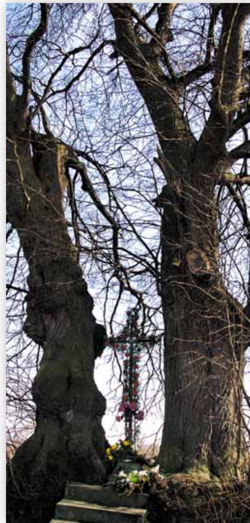
Mogiła powstańców styczniowych