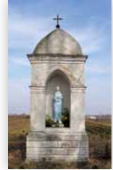
Przydrożna kapliczka (D.M.)