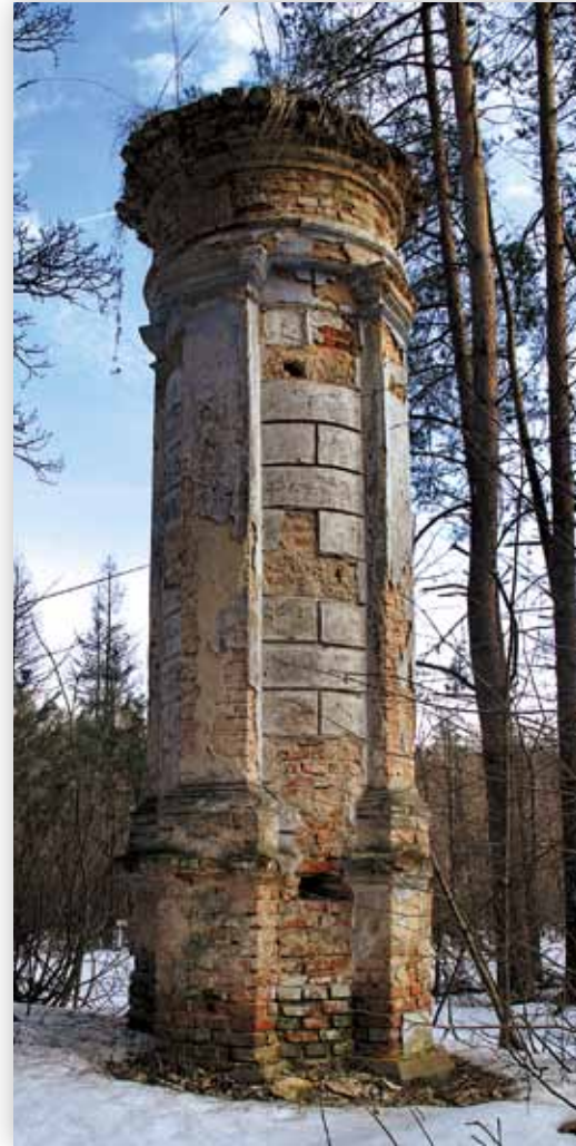
Stup graniczny klucza zawieprzyckiego (D.M.)

Obecnie na uwagę zasługuje murowana z cegły kapliczka z przełomu XIX i XX w. z rzeźbą Matki Bożej.