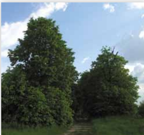
Aleja lipowa do dawnego folwarku (D.M.)