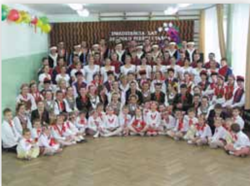
Jubileusz 20-lecia ZPiT „Jaworek” – styczeń 2006 r. (D.M.)