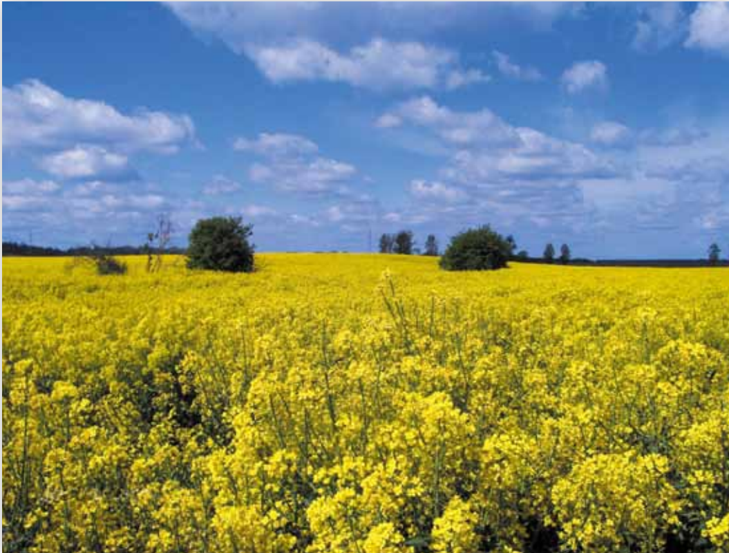
Uprawy rzepaku na okolicznych polach (Z.J.)

Wieś powstała przed I wojną światową na bazie ziemi dworskiej, którą rozparcelowano przez Bank Polski między chłopów-kolonistów. Nazwa pochodzi od licznych w tych okolicach mokradeł i stawów istniejących w szczątkowej formie do czasów współczesnych.