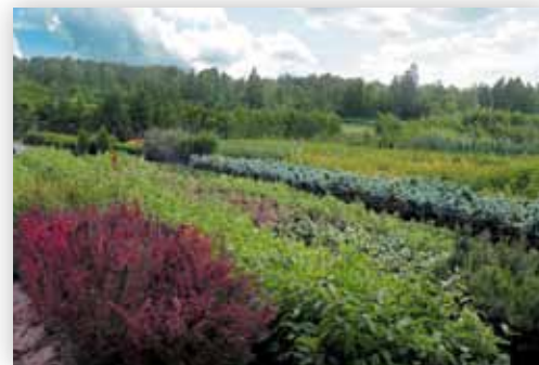
Okolice Kijan współcześnie są zagłębieniem szkółkarskim (Z.J.)