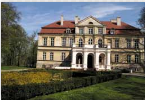
Pałac w Kijanach