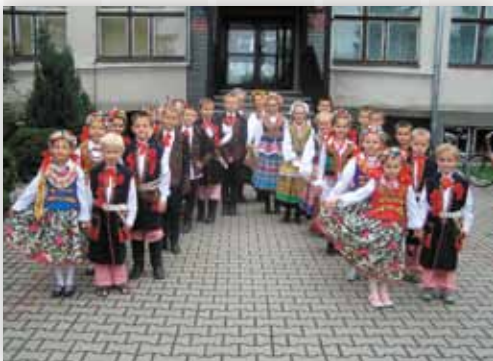
Młodsza grupa zespołu przed SP w Jawidzu (D.M.)