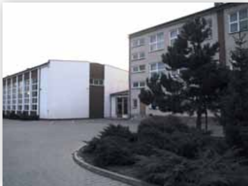
Szkoła podstawowa i gimnazjum (D.M.)