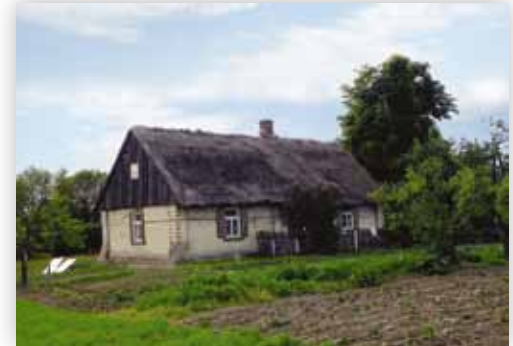
Tradycyjny dom z opoką kryty strzechą